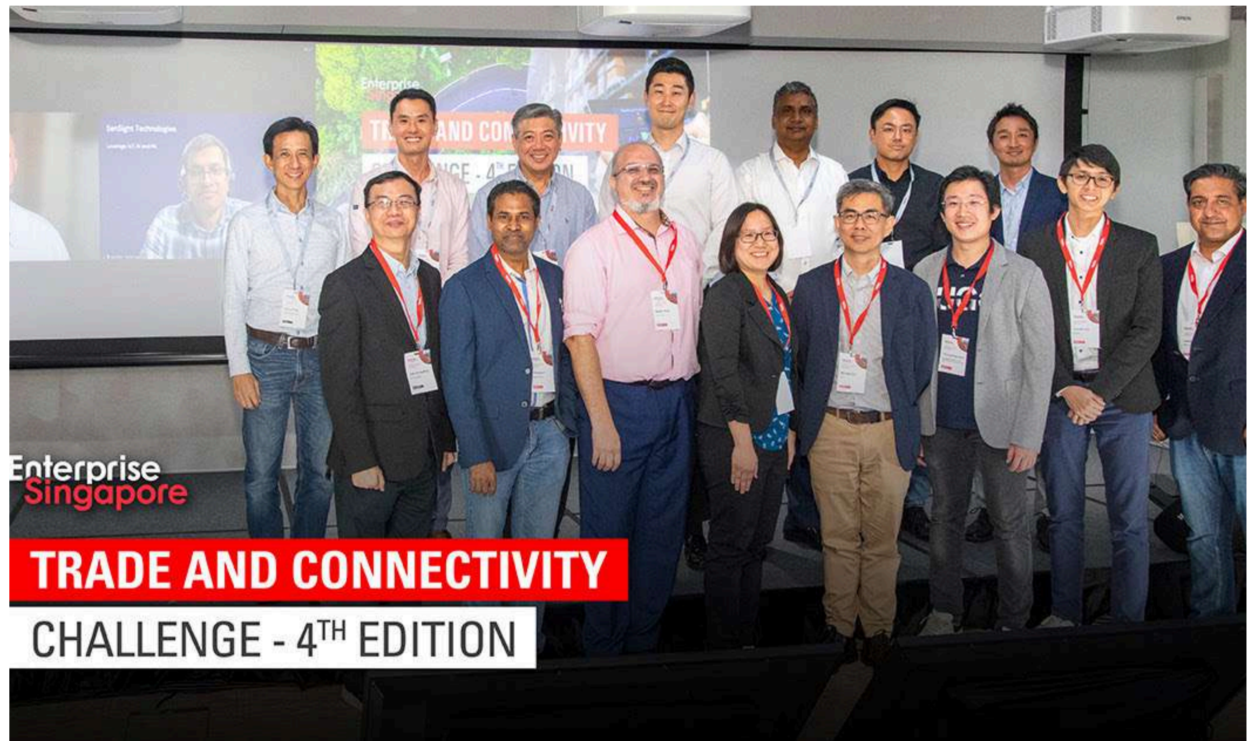
맵시, 싱가포르 통상상업부 기업청 Trade and Connectivity Challenge 최우수상 수상